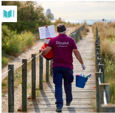
Imatge del nou Catàleg de Serveis

El Catàleg compta amb programes dels àmbits següents: sanitat ambiental, aigües de consum humà, establiments públics i indrets habitats, seguretat alimentària, suport tècnic en salut ambi-