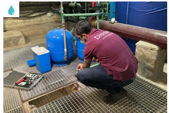
Actuacions als municipis

La redistribució territorial s'ha fet efectiva aquest passat mes de juny. Les modificacions que comportava - com els canvis d'interlocutor o l'eliminació de la figura del referent comarcal - s'han anat comunicat als ajuntaments abans que entrés en vigor.