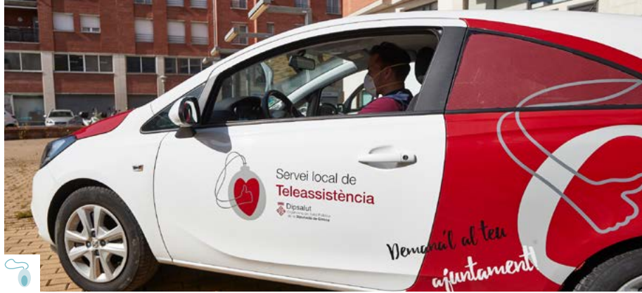
Vehícle del Servei local de Teleassistència

El Servei continua incorporant nous protocols enfocats a la prevenció i