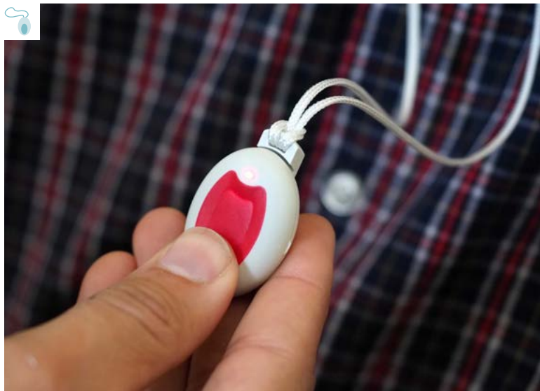
Detall del dispositiu d'avís de teleassistència

També es treballa en un sistema avançat de suport nocturn per reduir la càrrega de les persones cuidadores (camins de llum per prevenir caigudes a la nit, i dispositius de detecció d'enuresi o d'ocupació de llit). A més, els usuaris que requereixen un nivell de suport més alt (pel seu grau de dependència i per ser més vulnerables socialment) podran disposar d'un servei