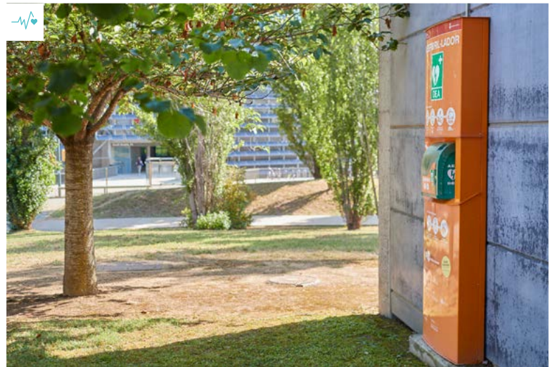
Imatge dels desfibril·ladors del Parc Científic de Girona

Els nous aparells tenen les mateixes característiques que els anteriors; també pel que fa al manteniment (Dipsalut en fa la gestió integral: revisió anual, neteja, re-