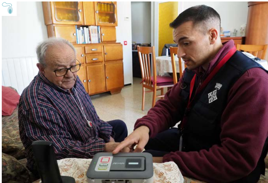
Visita del Servei local de Teleassistència

a la resposta ràpida, idònia i coordinada en diferents situacions. S'està ultimant el de prevenció del suïcidi, que s'afegirà als ja existents com, per exemple, el de prevenció d'abusos o maltractaments.