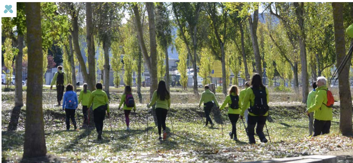
Dipsalut s'adhereix a la xarxa "Salut i Natura"

Amb la realització d'activitat física dirigida i en grup en entorns naturals, Dipsalut busca no tan sols millorar la salut i el benestar de les persones, sinó també la posada en valor de la natura com un actiu de salut, així com la implicació de tothom en la conservació dels espais naturals i en la generació de territoris sans i sostenibles.