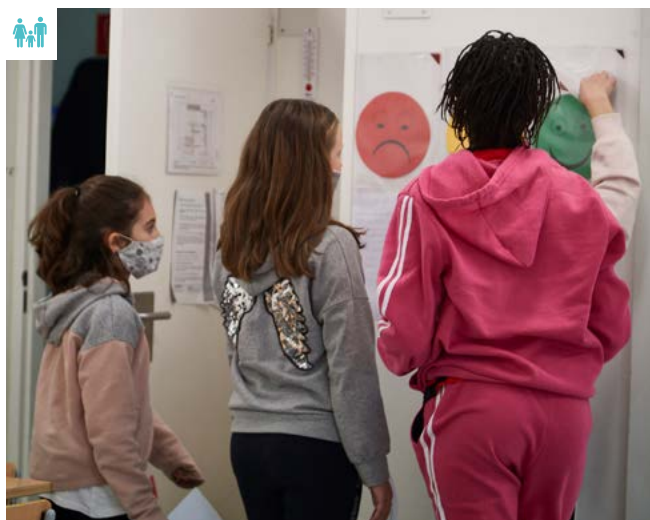
Fotografia d'arxiu del programa «Sigues tu»

En resum, la vida no està absent de conflictes, reptes i dificultats, i la manera com els afrontem és bàsica per a la nostra salut física, mental, emocional i relacional. Així doncs, val la pena emprar l'energia i el temps necessaris per acompanyar els infants en el desenvolupament de les seves competències socials, psicològiques i emocionals, per tal que les generacions futures assoleixin el major grau possible de benestar i justícia social.